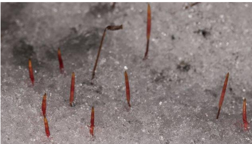
Ruig haarmos in de sneeuw geeft een mooi uitzicht