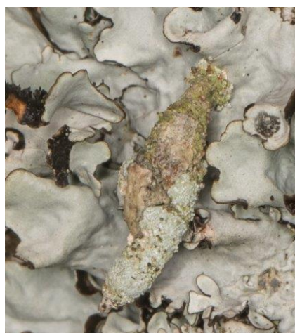
Hoornzakdrager op groot schildmos !