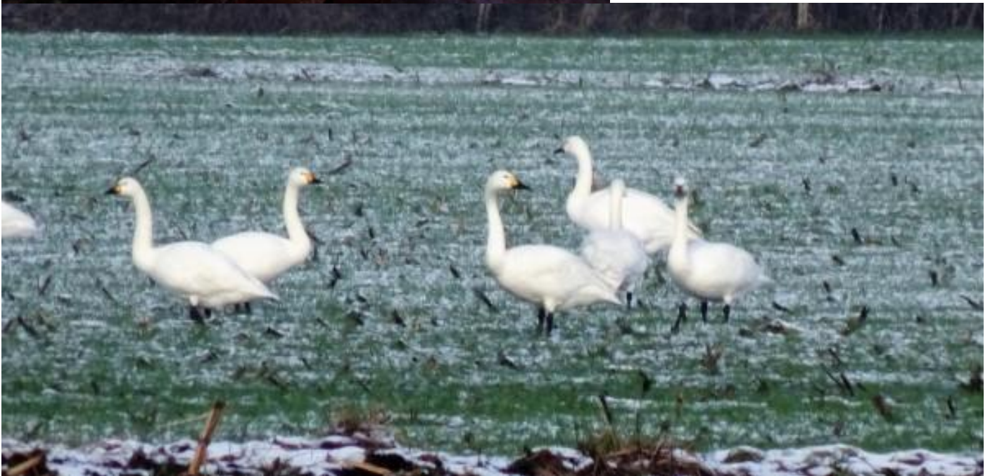
Kleine zwanen op uitstap in de Buitenhei