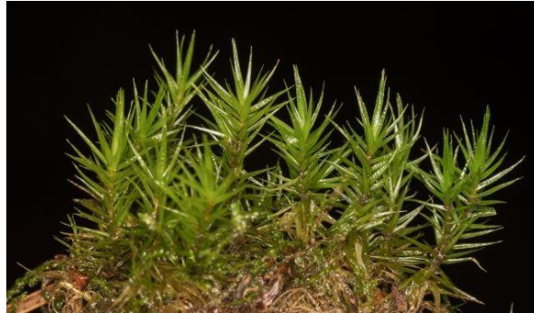
Gewoon gaffeltandmos (de rechte vorm !!)