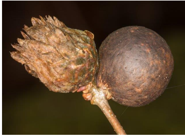
Knikker- en ananasgalwesp op 1 takje