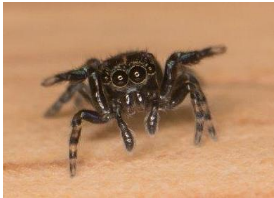
Harige springspin (meegekomen in potje)